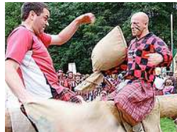
Immer feste druff

Lemgo-Lüerdissen. Gekämpft wird am Samstag und Sonntag, 22. und 23. Juni, im herrlich gelegenen Waldstadion. Die zehn gemeldeten Teams, ur-schottisch "Clans" genannt, könnten laut einer Pressemitteilung der Veranstalter noch Zuwachs bekommen. Nicht auszuschließen sei, dass sich die Zahl in der nächsten Woche auf zwölf erhöht. Damit würden sich rund 100 schottische Wettkämpfer in den einzelnen Disziplinen messen. Fest steht, dass am kommenden Wochenende eine reine Damenmannschaft in Kilt und Farbe antreten wird.